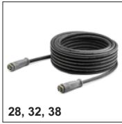
28, 32, 38